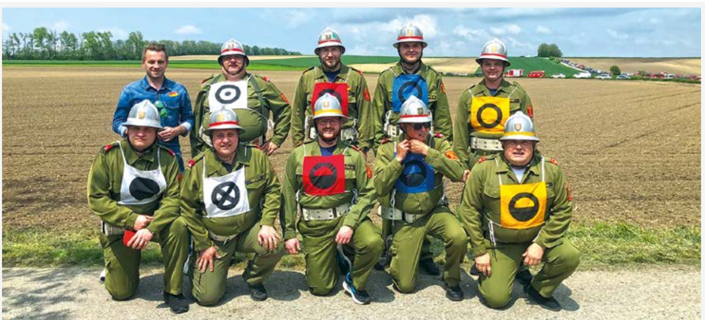
FF Zagersdorf bei den Bezirkswettkämpfen