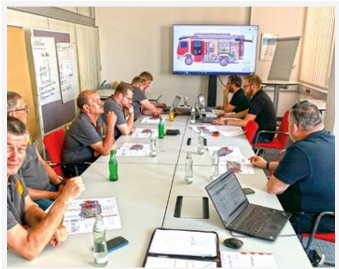
Rohbaubesprechung für das neue FF Auto